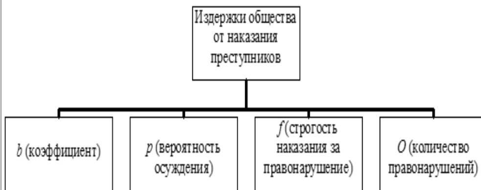
Рис. 2. Издержки общества от наказания преступников

3. Издержки общества от наказания преступников, которые зависят от O (количества правонарушений), p (вероятности осуждения) и f (строгости наказания за правонарушение). Эти издержки можно выразить формулой: bpfO .