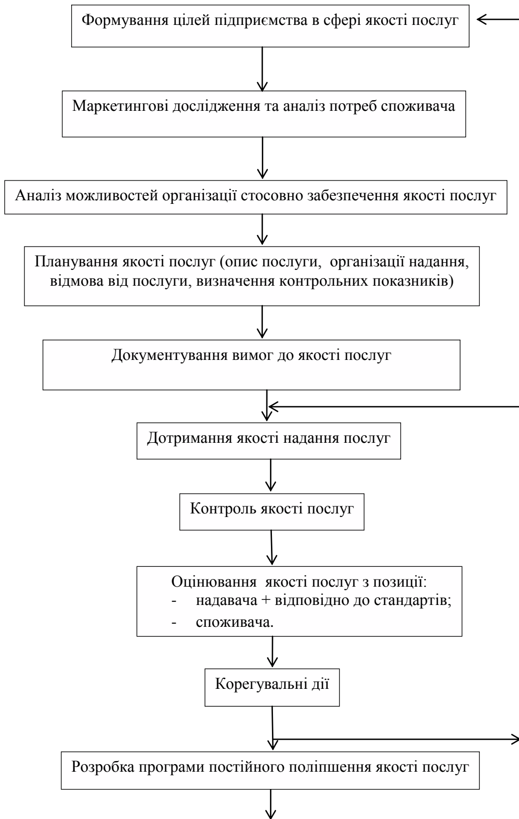
Рис. 2. Модель процесу управління якістю послуг Fig. 1. Model of service quality management process