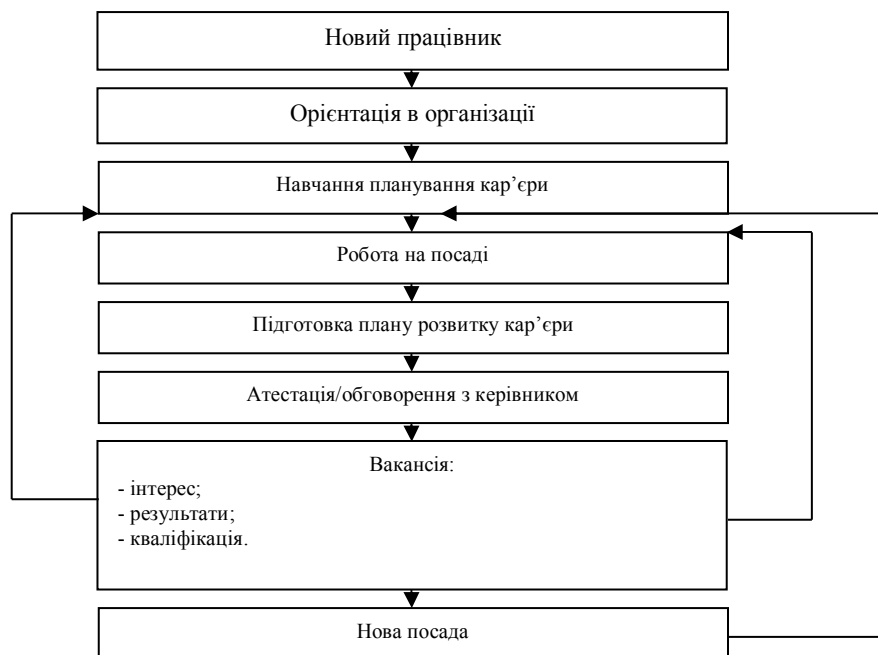
Рис. 2. Процес планування розвитку кар'єри.

Потреба в кар'єрному та професійному розвитку обумовлена необхідністю пристосовуватися до змін зовнішнього середовища, новим зразкам техніки й технології, стратегії й структурі організації, освоєння додаткових видів діяльності. Лінійні керівники на підставі спостереження, за працівниками і врахування потенціалу працівника, а також його думки про свої кар'єрні наміри повинні формувати конкретні цілі розвитку і навчання, а також план кар'єрного зростання (рис.3) [12].