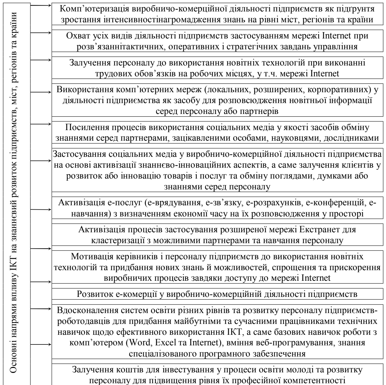
Рис. 2. Основні напрями впливу ІКТ на знаннєвий розвиток регіонів України* Fig. 2. The main ways of the influence of ICT on the development of knowledge of the regions of Ukraine *

цього підвищувати результативність виробничо-комерційної діяльності і прискорювати бізнес-процеси. Також обґрунтовано основні напрями впливу ІКТ на знаннєвий розвиток підприємств, що підвищить, прискорить та згладить асиметричний соціально-економічний розвиток регіонів України (рис. 2).