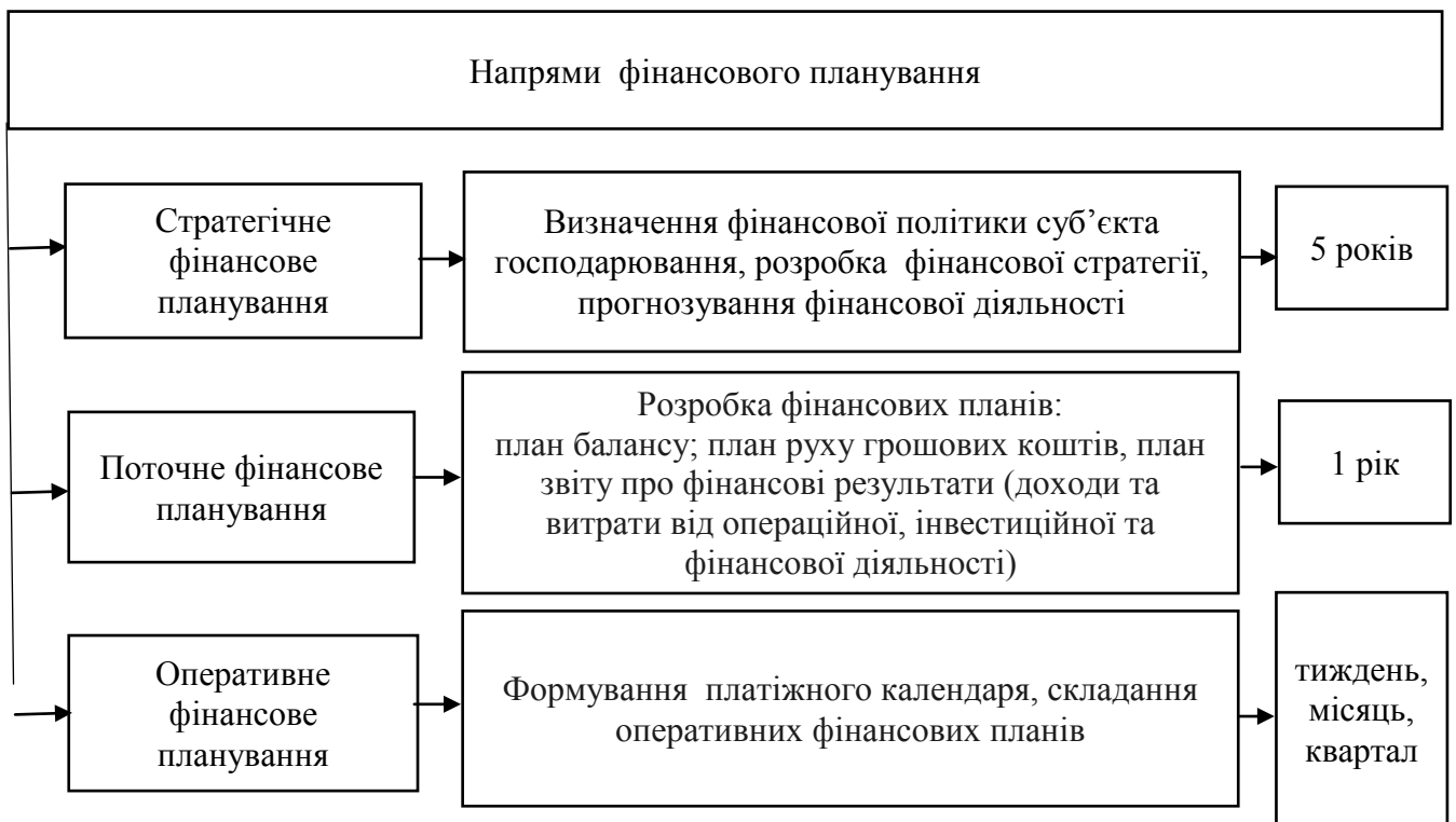
Рис. 2. Напрями фінансового планування*