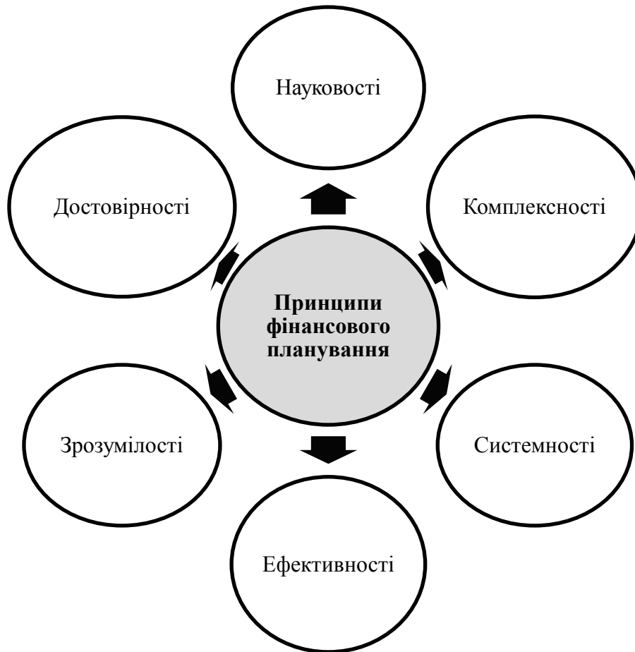
Рис. 1. Принципи фінансового планування*