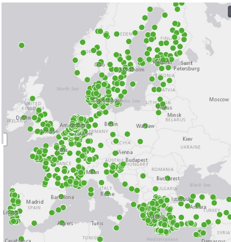
Рис. 2. Асиметрія готельної індустрії Green Key на карті Європи

Green Key – це міжнародна програма сертифікації підприємств сфери послуг гостинності, яка визначає стандарти екологічної сталості й відповідального бізнес-менеджменту [16]. Сертифікація готелів Green Key є дуже важливою для забезпечення сталого розвитку міжнародного готельно-туристичного бізнесу та збереження навколишнього середовища. Отримання сертифікату Green Key дає готельним підприємствам можливість продемонструвати свій зобов'язання щодо збереження навколишнього середовища та відповідального відношення до природних ресурсів. Також, сертифікація Green Key сприяє маркетинговій діяльності у залученні туристів, оскільки зростає чисельність споживачів із вмотивованою екологічною поведінкою на ринку туристичних послуг. На Рис. 1 представлена карта Європи з відображенням асиметрії розподілу сертифікованої готельної індустрії Green Key.