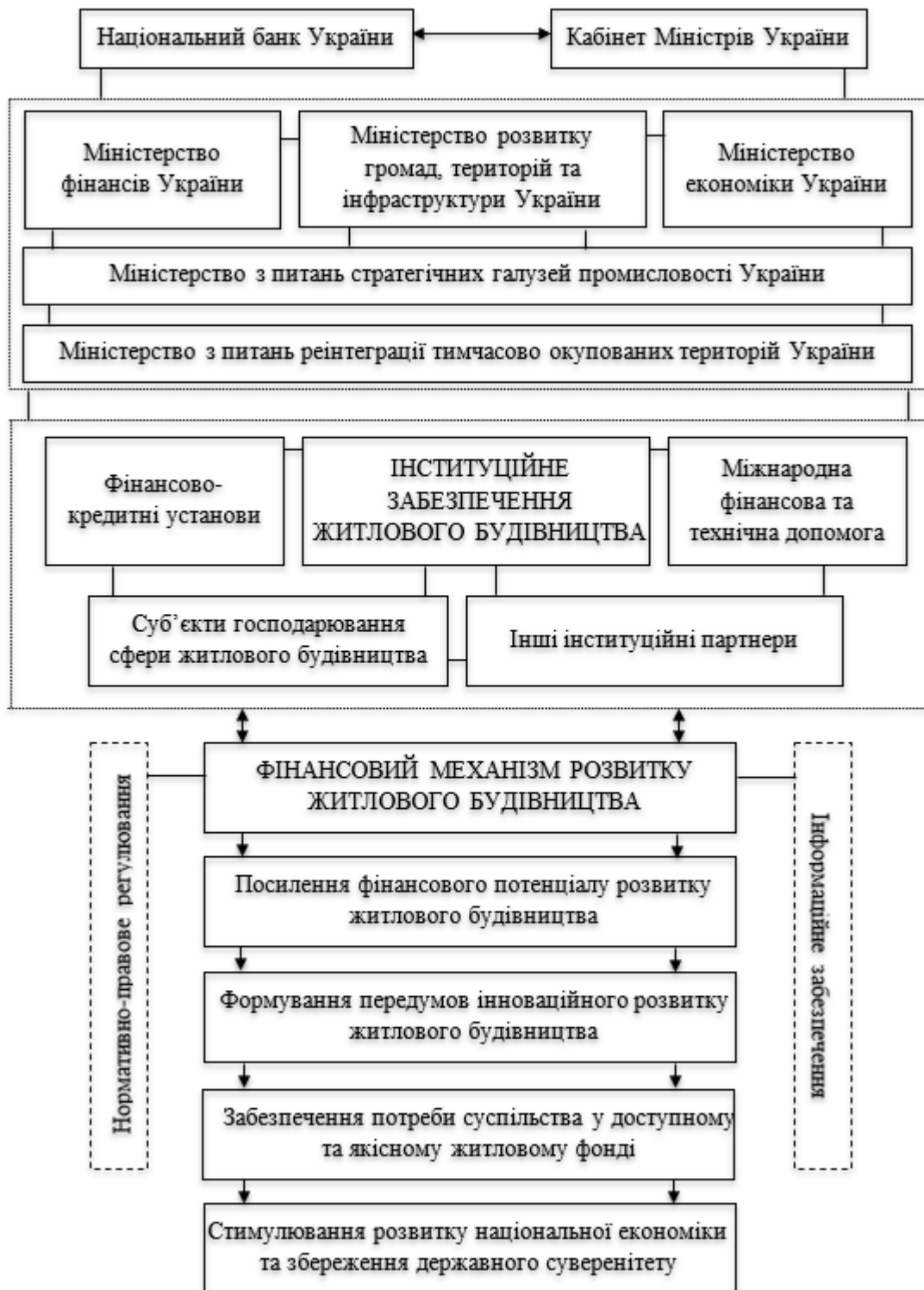
Рис. 2. Роль інституційного забезпечення у розвитку фінансового механізму житлового будівництва