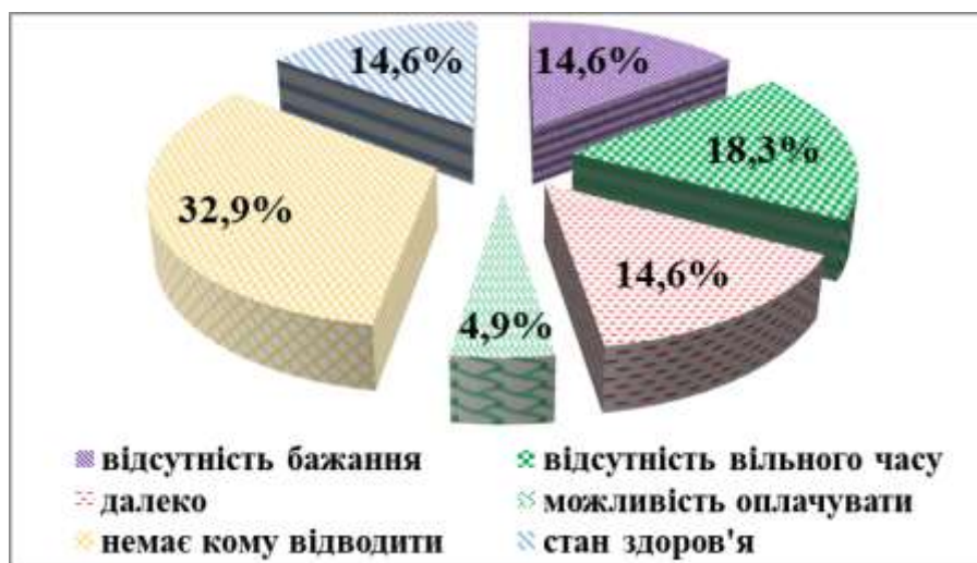
Рис. 2. Причини, що перешкоджають батькам залучати дітей до занять фізичними і спортивними вправами.

З опитування видно, що більшість дітей мають бажання займатися різними видами рухової активності. Однак, значна кількість батьків вказали на головну причину (неможливість супроводу дітей на заняття), яка стоїть на заваді відвідування дітьми спортивних занять (рис. 2). Інші вказали на брак часу, відсутність бажання, значну відстань, стан здоров'я та фінансові труднощі (див. рис. 2).