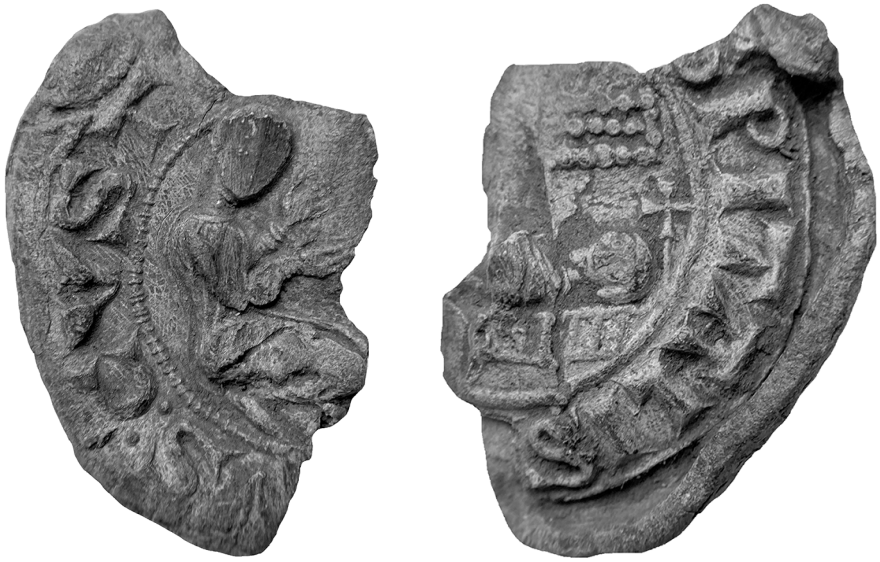
Іл. 1. Печатка магістра Ордену госпітальєрів з Кривоша (аверс, реверс)