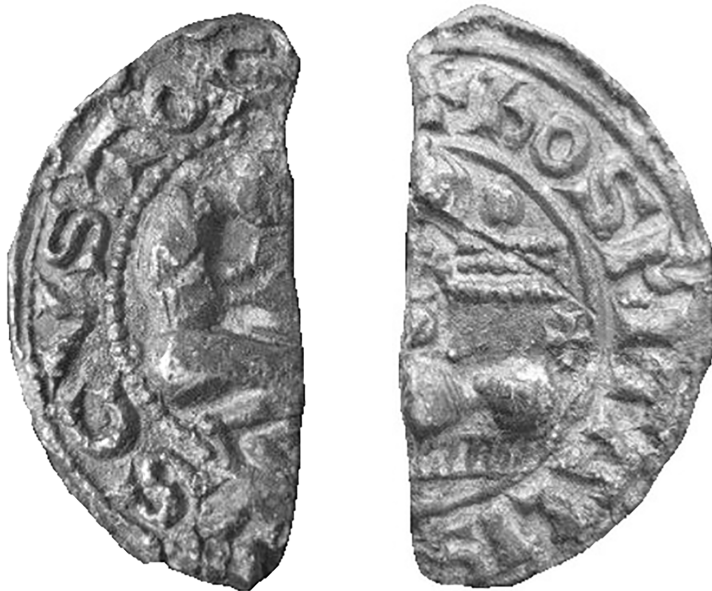
Іл. 2. Печатка магістра Ордену госпітальєрів з-під Володимира (аверс, реверс)