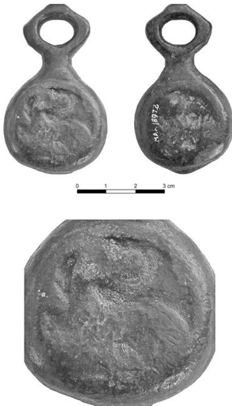
Іл. 1. Бияк кистеня з Крилоса

вживані «гиря» 6 , чи, рідше, «тягарець» 7 . Що цікаво, до належних інтерпретацій західноукраїнських бияків кистеня дійшло доволі пізно.