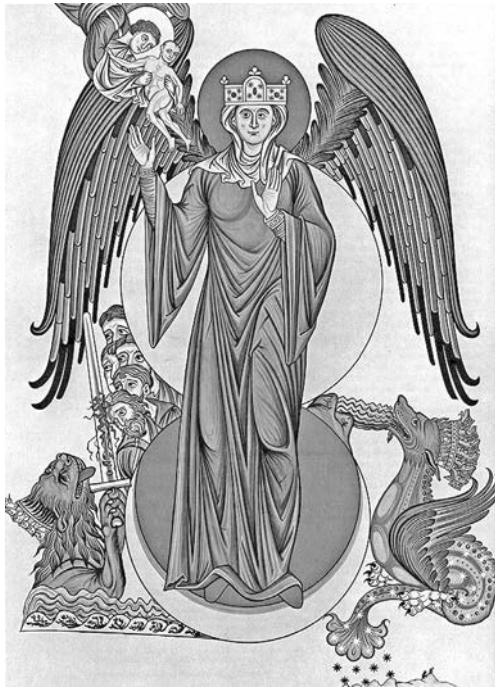
Іл. 4. Наречена, зодягнена в сонце з «Апокаліпсиса» св. Іоанна Апостола. Ілюстрація із «Саду насолод» (бл. 1180) Герради Ляндсберзької ( https://commons.wikimedia.org/wiki/File:Woman_of_the_Apocalypse_(Hortus_deliciarum).jpg ; публічний доступ)

рельєф після зіставлення з аналогами країн, належних до латинської цивілізації, слід датувати третьою чвертю XII ст. 11 Варто зауважити, що стилістичну схожість до нього можна знайти не тільки в різьбі, а й у мініатюрах рукописів, як, для прикладу, у « Sadi nasolod » (« Hortus deliciarum ») Герради Ляндсберзької (іл. 4). Наведена ілюстрація напряду підкреслює зв'язок дракона з Марійним культом та « Апокаліпсисом » св. Іоанна. Hyperdulia властива як Католицькій, так і Православній церквам, відтак рецепція романського відтворення дракона у формі кам'яного рельєфу не становила жодної проблеми для мешканців Галича. Якщо ж насправді існує певна хронологічна залежність між драконом із Успенської церкви та драконом (драконами?) кистеня, він може походити щонайраніше з другої половини XII ст. Аргументом — хоча й відверто недостатнім — щодо виготовлення оздоби бронзового бияка за взірцем зображення зі стін храму Галича можуть слугувати вкрай рідкісні знахідки подібних предметів матеріальної культури з рельєфними зооморфними зображеннями. Дочасна археологічна література знає лише два приклади такого стибу — бияк із зображенням лева, знайдений у Каневі, та бияк із зображенням птаха з Новгороду 12 .