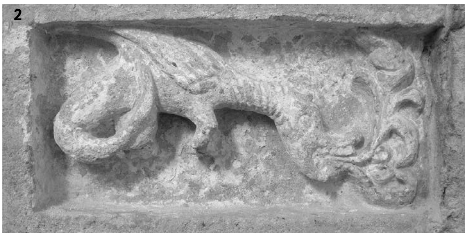
Іл. 3. 1 – церква Успіння Пресвятої Богородиці в Крилосі; 2 – рельєф Богородичного собору XII ст., вмурований до стіни Успенської церкви (1, 2 – фото Р. Лівоха)