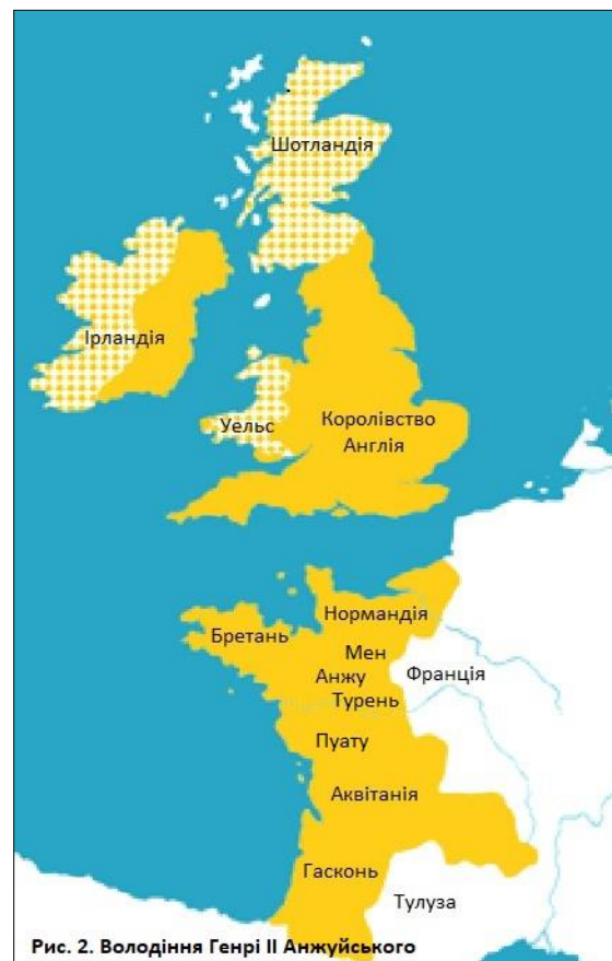
Рис. 2. Володіння Генрі II Анжуйського

Політичні структури середньовіччя, як видно з прикладів так званих нормандської, аквітанської, англійської та анжуйської імперій, слід розглядати як мережі відносин, а не як абстрактні організації. Влада здійснювалася над людьми, а не над територіями. Карта умовної «Анжуйської імперії», яка б натякала – за допомогою зафарбування всіх провінцій одним кольором (див. рис. 2) – що влада, наприклад, Генрі II була однаково ефективною всюди, була б серйозно оманливою. Наприклад, Англія управлялася більш інтенсивно завдяки мережі графств, тоді як у континентальних володіннях влада правителя була більш «плямистою». Анжуйські королі не здійснювали однакової влади з однаковою інтенсивністю над іншими територіями, головним чином тому, що вони не мали такої ж адміністративної структури та мережі чиновників, як в Англії. Картографування меж «комполітичної монархії Генрі II» є непростим завданням, головним чином тому, що ми маємо справу не з чіткою лінією, а з прикордонною зоною, де права Генрі та сусідніх правителів перепліталися і накладалися. Можна навіть сказати, що самі анжуйські королі не знали точних меж своїх володінь. Вони, ймовірно, знали (або могли дізнатися) про