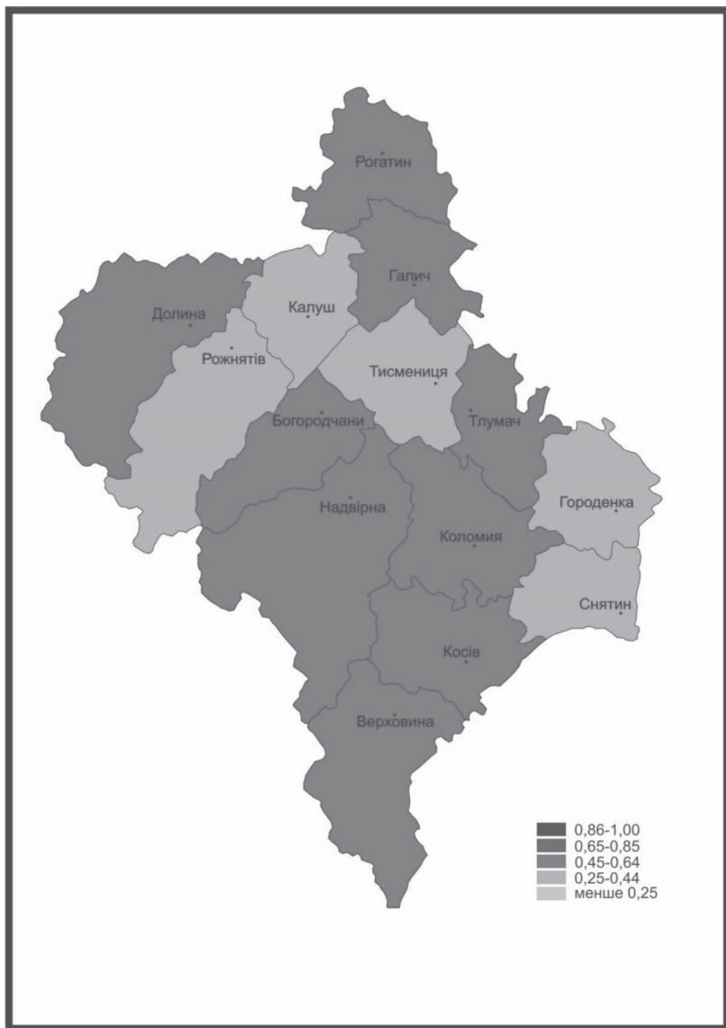
Пізнавальна цінність сакральних комплексів Івано-Франківської області місцевого значення