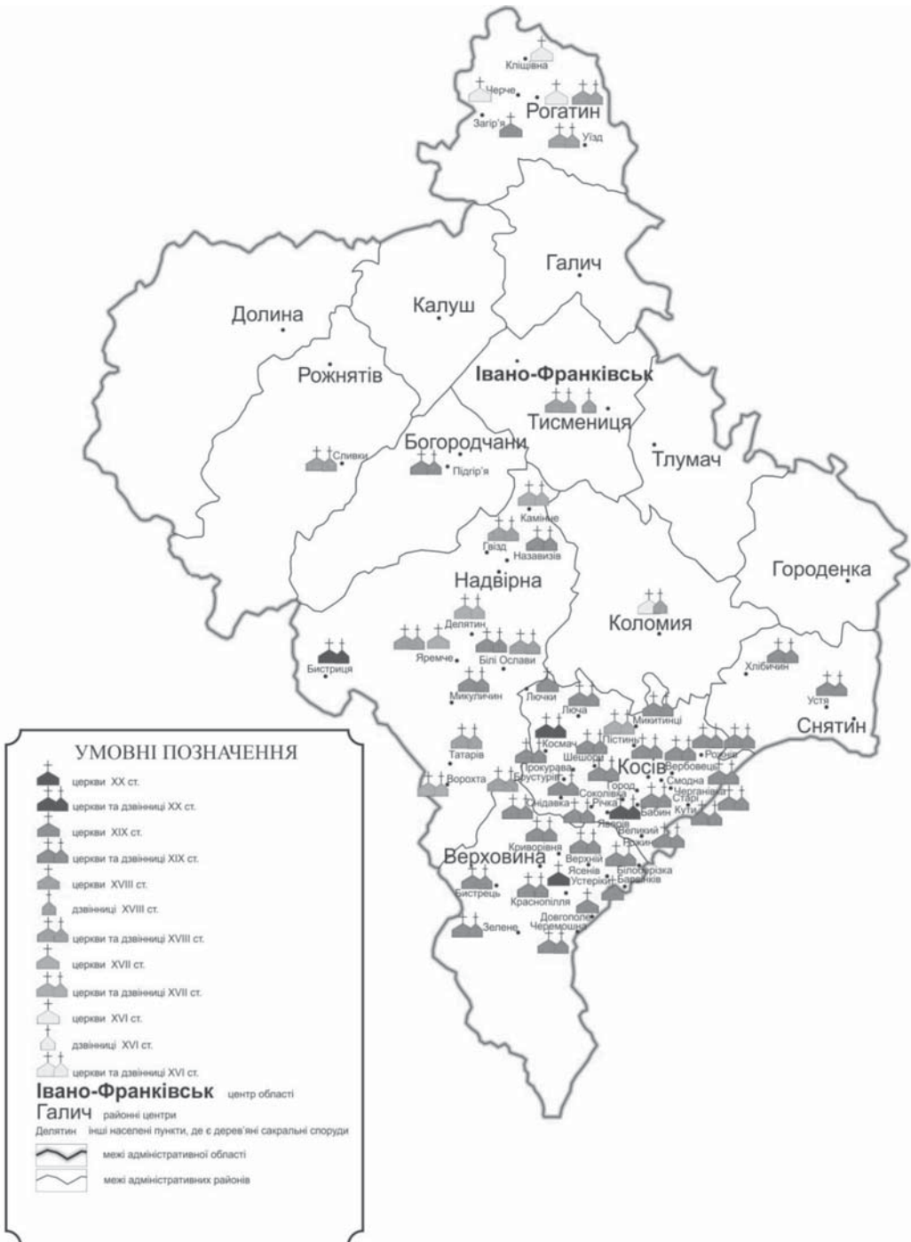
Дерев'яні церкви Івано-Франківської області національного значення