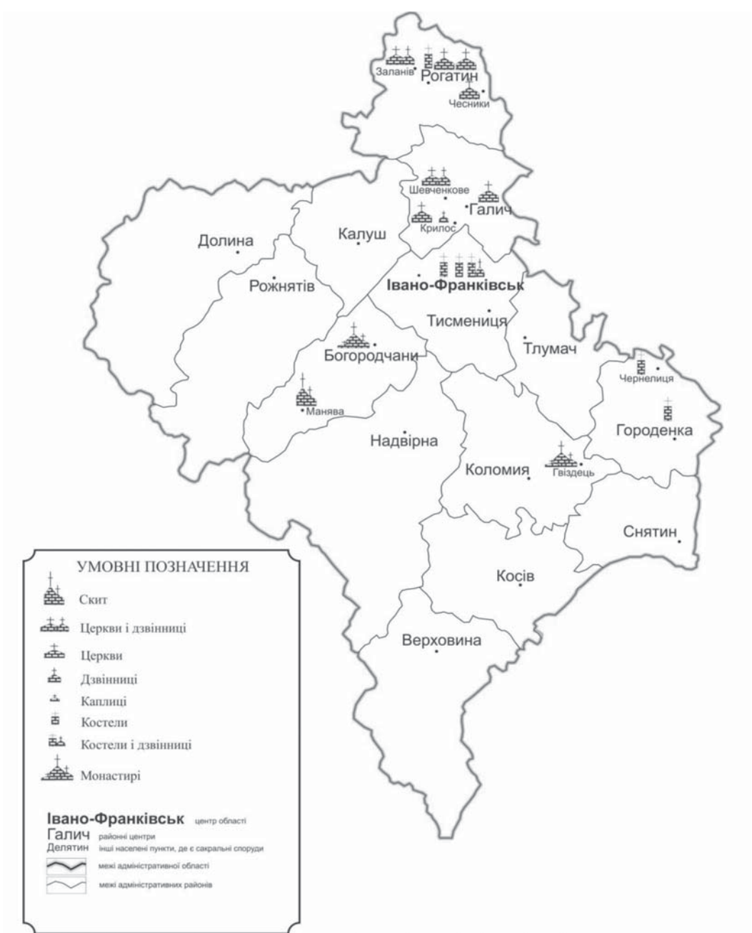
Кам'яні сакральні комплекси Івано-Франківської області національного значення