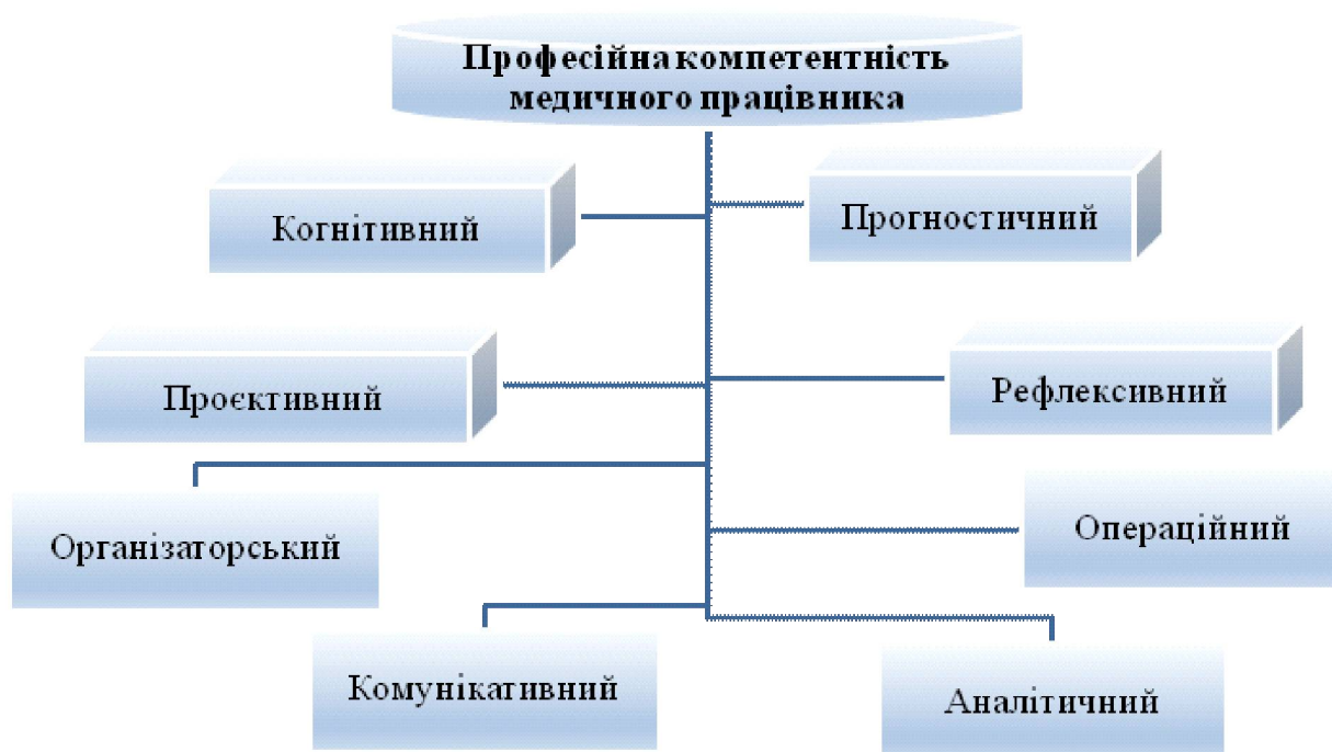
Рис. 2. Складники професійної компетентності майбутнього медичного працівника

лення практичної спрямованості дисциплін, оптимальне використання їх виховного потенціалу та інше. На міркування науковців, якість професійної підготовки тісно пов'язана, з одного боку, з інноваціями, розвитком науки і техніки, а з іншого – з асигнуваннями з боку держави: високий відсоток вкладень слугує підвищенню ефективності професійної підготовки майбутніх фахівців. Відтак ефективність формування професійної компетентності можемо визначати й через рівень демократичності суспільства, а отже, навчання у ЗВМО має базуватись на принципі студентоцентризму, індивідуального підходу; бути зорієнтованим на формування та розвиток самодостатньої, талановитої, унікальної особистості. Професійна компетентність як результат професійної підготовки виявляється у використанні набутих знань, умінь і навичок, пристосуванні до умов життя, праці, самореалізації. О. Куклін визначає її як граничну індивідуальну, що для кожної окремо взятої особистості може виражатись у задоволенні її внутрішніх потреб, підвищенні рівня доходів, соціального статусу (Куклін, 2008, с. 198). Це дає підстави виокремити внутрішню, що визначається рівнем успішності навчання, та зовнішню професійну підготовку, яку віддзеркалює рівень кваліфікації фахівців, їх адаптованість до подаль-